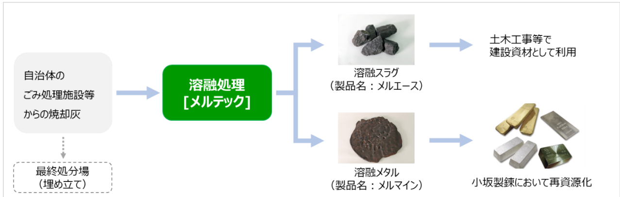
メルテックにおける廃棄物の再資源化フロー