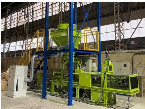
バイオコークス製造装置

当社グループは今後も引き続き、国内外における環境・リサイクル事業の強化を通じて、持続可能な社会の構築およびカーボンニュートラル社会の実現に貢献していきます。